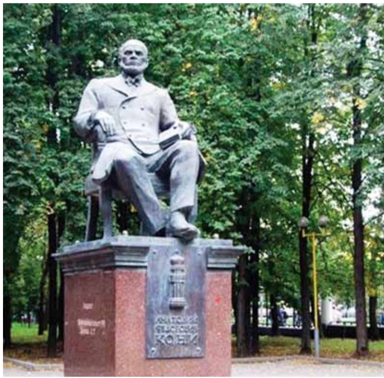
Памятник А.Ф. Кони, установленный в сквере перед социальным факультетом МГУ