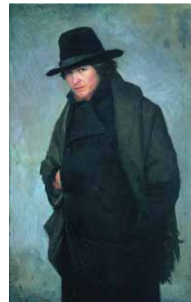
Николай Ярошенко «Студент», 1881 год

— Четыре года. Но так было везде, кроме медицинского факультета, где учеба длилась пять лет. Выпускник юридического факультета, сдавая экзамены, мог получить звание действительного студента, если он сдал положительно все экзамены, но не писал сочинение — кандидатское рассуждение, как это тогда называлось. Если