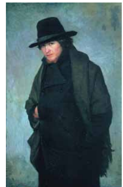
Николай Ярошенко «Студент», 1881 год

— Четыре года. Но так было везде, кроме медицинского факультета, где учеба длилась пять лет. Выпускник юридического факультета, сдавая экзамены, мог получить звание действительного студента, если он сдал положительно все экзамены, но не писал сочинение — кандидатское рассуждение, как это тогда называлось. Если