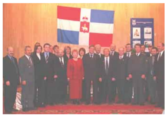
2003 год. Лауреаты и организаторы той самой первой церемонии вручения Премии Клуба юристов в актовом зале областной администрации