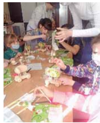
Мастер-класс для маленьких пациентов и их мам.