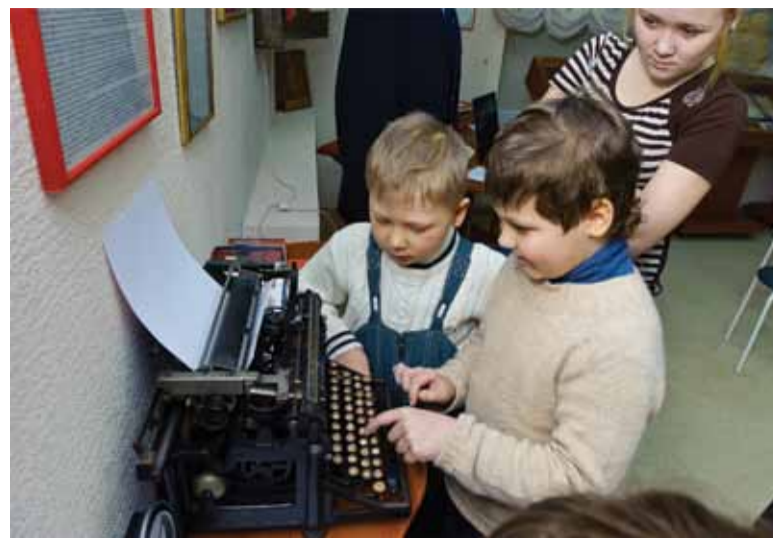
Маленькие пациенты Детского онкогематологического центра им. доктора Ф.П. Гааза знакомятся с Музеем юстиции Пермского края.

При подготовке статьи были использованы публикации «Вестника пермского университета», издания «Урал. Страницы истории» и журнала «Ретроспектива».