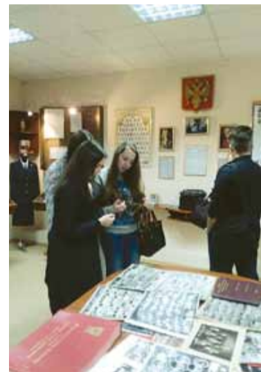
Экскурсия для слушателей «Весенней школы по праву».