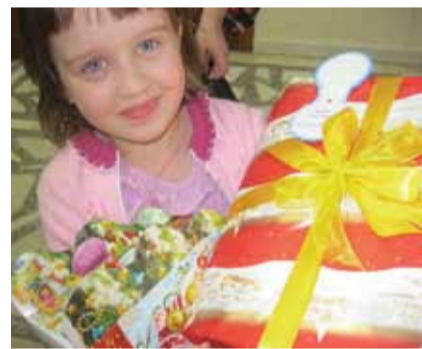
Каждый год члены Клуба юристов с огромным удовольствием передают ребятам, находящимся на лечении в онкогематологическом центре, новогодние подарки.